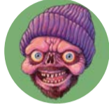
Autoportrait