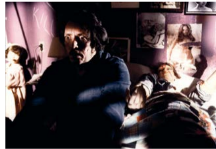
Maniac de William Lustig

Qui n'a jamais rêvé de voir ou revoir des classiques du cinéma en haute définition ? Avec la complicité de l'éditeur Le Chat qui fume, le Festival accueille cette année une toute nouvelle section rétrospective dédiée à des œuvres de patrimoine restaurées en 4K : RétroMania . Deux films ont été sélectionnés à ce jour : Maniac de William Lustig (1980) et un film français de Claude Mulot, La Rose écorchée (1970).