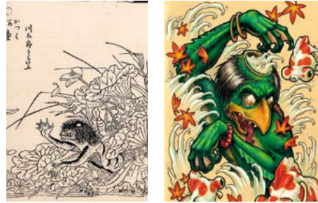
Kappa (dessin de Toriyama Sekien - vers 1750) Kappa (illustration de Stef W)

Du mardi 29 janvier au samedi 23 février, l'exposition Monstres et esprits du Japon invite à voyager au cœur de la culture fantastique nipponne. Place aux Yōkai, insaisissables et attirantes créatures aux pouvoirs surnaturels apparues dans la tradition orale dès l'Antiquité et le Moyen-Âge, mais aussi aux Yūrei, des revenants très présents dans les contes, et aux monstrueux Kaijū, dont le plus populaire d'entre eux : Godzilla.