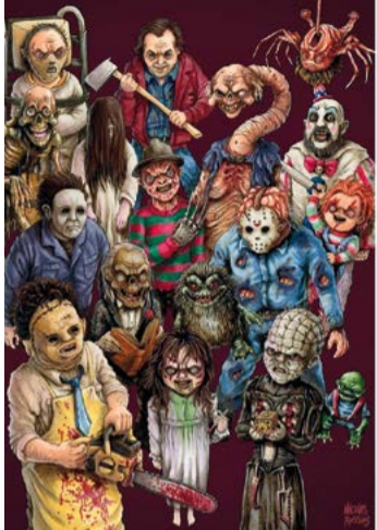
Horreur film famille

Celui-ci donne naissance à des personnages cauchemardesques, grotesques, mais aussi attachants, inspirés de la pop culture des années 1980-1990 et du cinéma horrifique. Vernissage le 1 er février à 19h30, en présence de l'auteur.