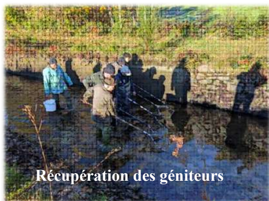
Récupération des géniteurs

Les autorisations pour la récupération des géniteurs sont toujours longues à obtenir avec une volonté de nous mettre des bâtons dans les roues, car certaines personnes dirigeantes sont contre les écloseries mais nous ne nous laisserons pas faire !