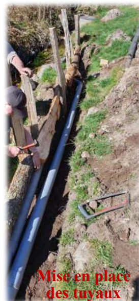
Mise en place des tuyaux

Au 14/11/2025, nous avons 4000 œufs en incubation pour 5 femelles et 1 mâle.