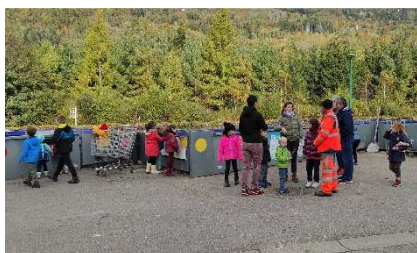
Visite de la déchèterie de Saulxures/M. par les écoliers de Cornimont