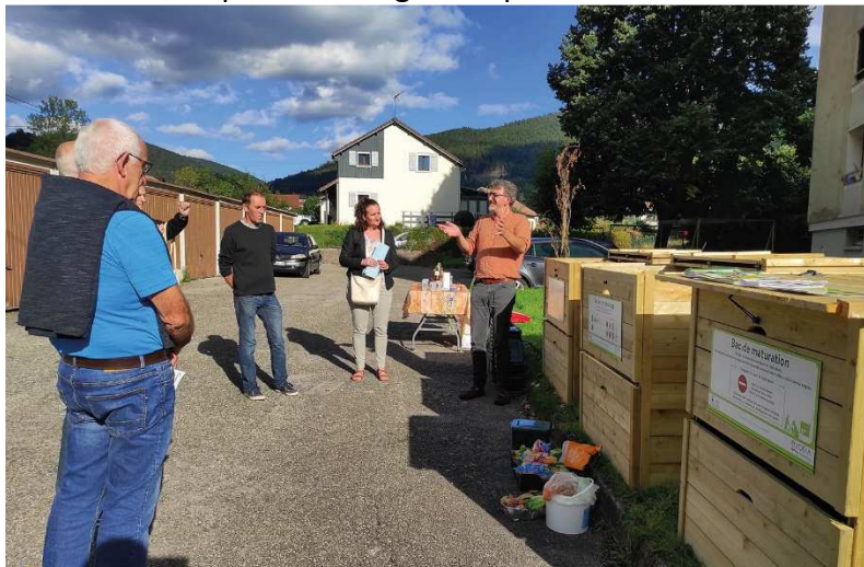
Inauguration d'un site de compostage partagé avec VOGELIS Cornimont

La CCHV accompagne les habitants et les entreprises dans cette réflexion en déployant des actions dans différents secteurs d'activités : installation de composteurs collectifs en pied d'immeuble, ateliers de sensibilisation sur le gaspillage alimentaire auprès du public et au sein des établissements scolaires, ateliers « couches lavables » auprès des professionnels de la petite enfance et des personnes âgées dépendantes.