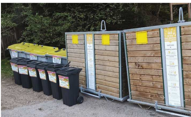
Bacs différenciés et stand sur le tri pour le triathlon de Gérardmer