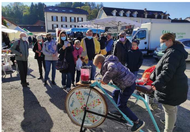
Animation de sensibilisation au Gaspillage alimentaire Gérardmer (semaine du goût du 11 au 17 octobre)